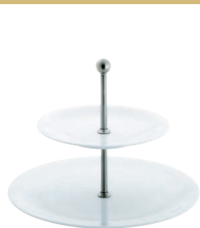
2 Teller/2 plates, 31cm, 21,5cm