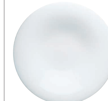
Pasta Grande 30 cm