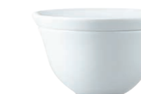
Snackteller/Snack plate, 14 cm Milchkaffeeschale/Café-au-lait bowl, 0,50 l