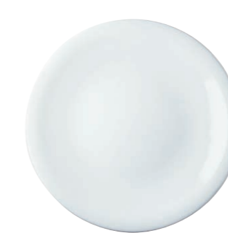
Kuchenteller/Dessert plate, 20 cm Essteller/Dinner plate, 26,5 cm