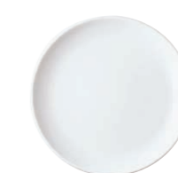
Snackteller/Snack plate, 14 cm