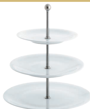
3 Teller/3 plates, 31cm, 26,5cm, 21,5cm