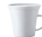
Minisnackteller/Mini-snack plate, 10 cm Cappuccino-Obertasse/Cappuccino cup, 0,22 l