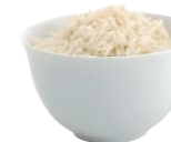
Reisschale/Rice bowl, 11 cm