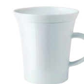
Minisnackteller/Mini-snack plate, 10 cm Henkelbecher/Mug with handle, 0,30 l