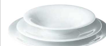
Pastateller/Pasta plate, 22 cm Essteller/Dinner plate, 26,5 cm Pizzateller/Pizza plate, 31 cm