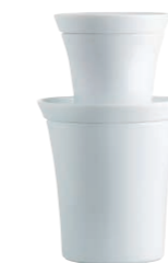
Dipschälchen/Dishes for dips, 8 cm Teeschälchen/Tea bowl, 0,09 l Minisnackteller/Mini-snack plate, 10 cm Becher/Mug, 0,30 l