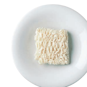
Pastateller/Pasta plate, 22 cm