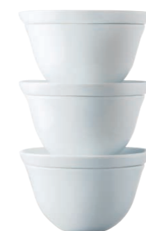
Snackteller/Snack plate, 14 cm Milchkaffeeschale/Café-au-lait bowl, 0,50 l