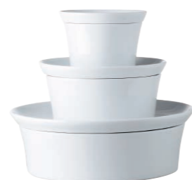
Ragout-fin-Form/Ragout fin dish, 9 cm Souffléform/Soufflé dish, 13,5 cm Auflaufform/Baking dish, 20 cm