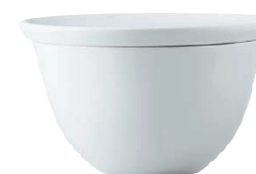
Frühstücksteller/Breakfast plate, 21 cm Salatschüssel/Salad bowl, 19 cm